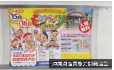
沖縄県職業能力開発協会