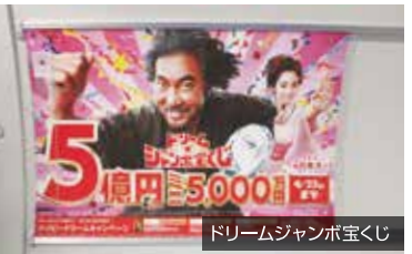
ドリームジャンボ宝くじ