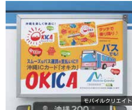
モバイルクリエイト