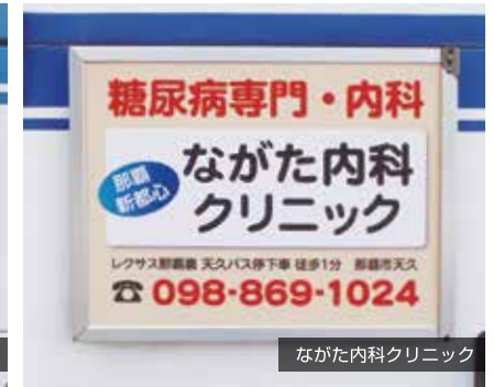
ながた内科クリニック