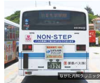
ながた内科クリニック