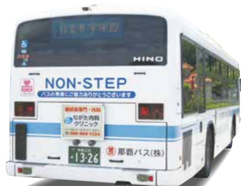
ながた内科クリニック