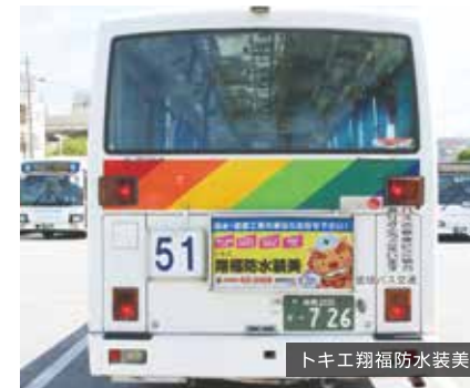
トキエ翔福防水装美