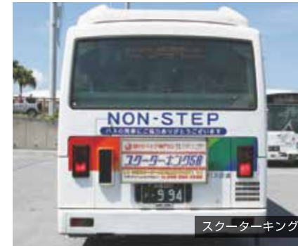
スクーターキング