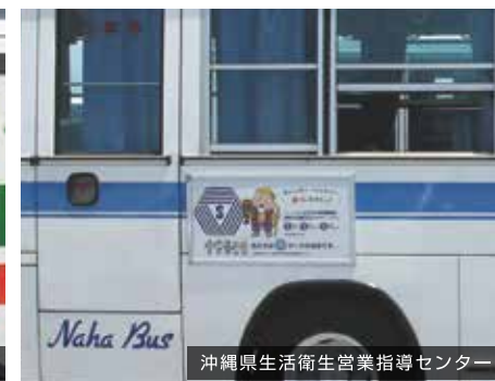
沖縄県生活衛生営業指導センター