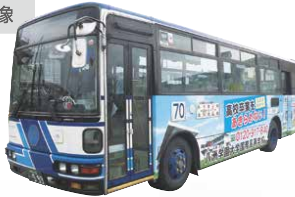
八洲学園大学 国際高等学校