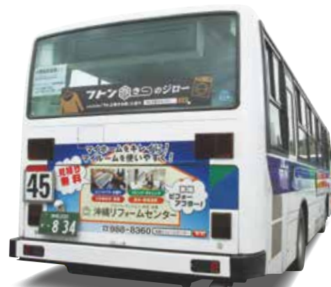
沖縄リフォームセンター