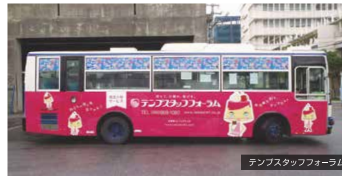
テンプスタッフフォーラム